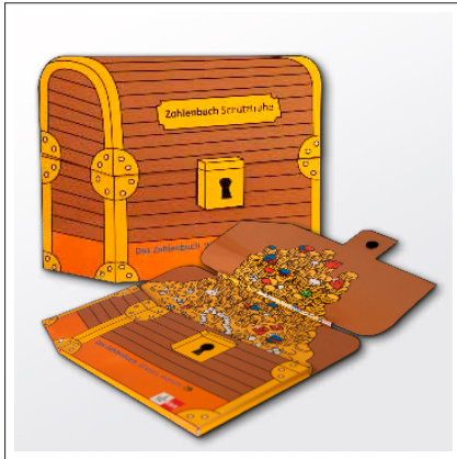
Schatztruhen-Mappe mit Froschtasche