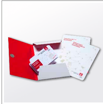
Mini-Mappe mit Mini-Faltplaner und Registerkarten