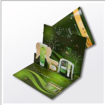
3D-Mappe mit Drehscheibe und Prospekt